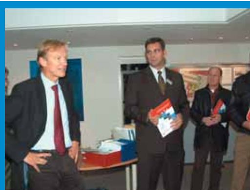
Senatsbaudirektor Uwe Bodemann (links) eröffnete die Ausstellung. Er betonte die große Bedeutung der Umgestaltung des Hemelinger Marktplatzes für das gesamte Quartier: „Das neue Zentrum wird in Verbindung mit vielen Einzelmaßnahmen im Sanierungsgebiet Hemelingen – zum Beispiel mit der Entwicklung von Wohnbauland in der Diedrich-Wilken-Strasse – die Zukunft des Ortsteils langfristig sicher stellen.“