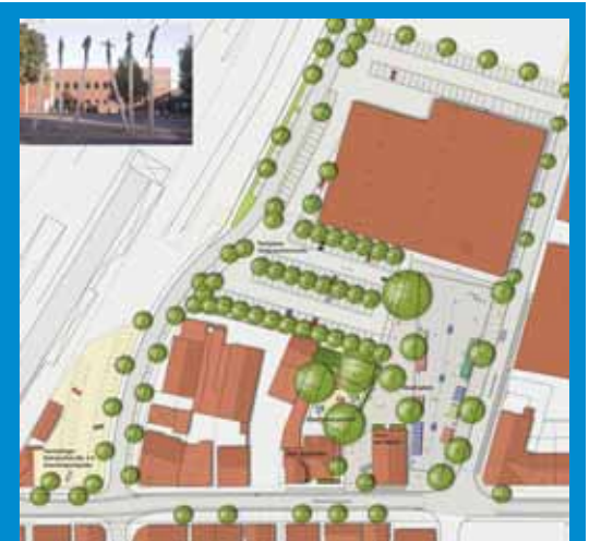
Der Siegerentwurf von Kreikenbaum und Heinemann wurde bereits auf einer öffentlichen Sitzung des Beirats vorgestellt und dort mit viel Lob bedacht.