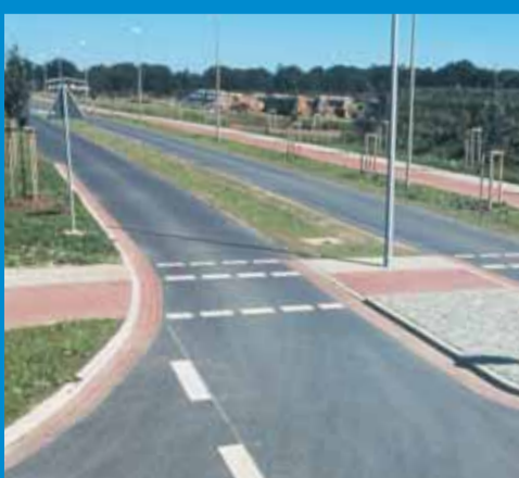
Konzept Büro Lepère