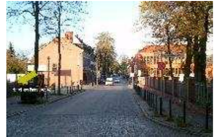
Hemelinger Bahnhofstr. 42 (3)

Nutzungsart: Gewerbe Erschliessung: Erschlossen Bebaubar nach: Bebauungsplan Empfohlene Nutzung: Büro, Doppelhaushälfte, Einfamilienhaus, Einzelhandel - klein, Gastronomie, Gewerbe, Hotel, Kleingewerbe, Mehrfamilienhaus GRZ: 0,80 GFZ: 2,40 Verfügbar ab: sofort