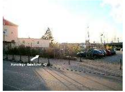
Hemelinger Bahnhofstr. 42 (2)

siehe auch unter: http://www.immobilienscout24.de/35782066