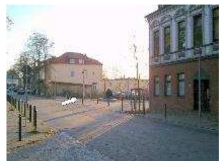
Hemelinger Bahnhofstr. 42 (1)