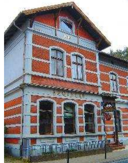
Vorderansicht "alte Apotheke"

Objektzustand: Unrenoviert Baujahr: 1889 Etage(n): 3